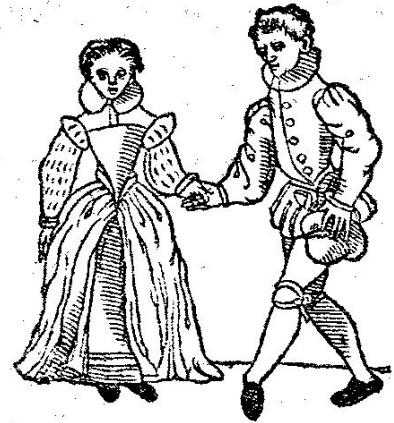
De Reverence , een danspas in de basse danse. Uit: Thoinot Arbeau (1520 – 1595), Orchésographie (1589).

In de 15e eeuw was de bergerette een Frans lied met een pastoraal thema, qua structuur verwant aan de virelai (amoureuus lied met reïrenen), maar met één strofe. De tekst van het lied werd op een bekende melodie gezongen.