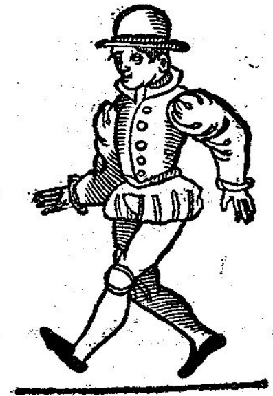
De Capriol , een danspas in de gaillarde . Uit: Orchésographie , 1589.

Frans Schröder, Delft, september 2016; 29-3-2018.