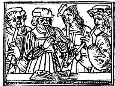
Voorpagina van S'ensuyvent plusieurs Basses dances tant Communes que Incommunes , dansboek gepubliceerd door Jacques Moderne in 1532 of 1533.