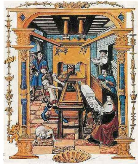
Afbeelding van een drukkerij (ca. 1530) weergegeven als miniatuur in een manuscript (Bibliothèque National, Paris).